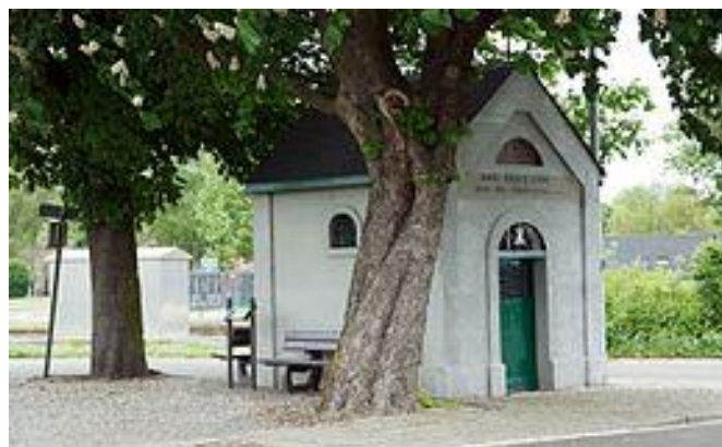
Links: De abdy Postel in Mol en rechts een kapelletje onderweg.

Na het lekker diner vertrekken we weer huiswaarts, nog nagenietend van het lekker eten en vooral van de mooie rondrit door de prachtige Brabantse dorpjes.